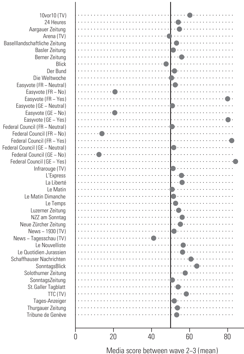
Figure 2b: Wordscores of newspaper outlets and television formats (mean position). Wave 2–3

Note: The media score indicates the position of the media (over the campaign) on the No-Yes one-dimensional ideological scale. For example, a media with a media score of 60 more strongly emphasized (i.e., more often) Yes policy arguments than a media with a score of 45, which rather emphasized No policy arguments.